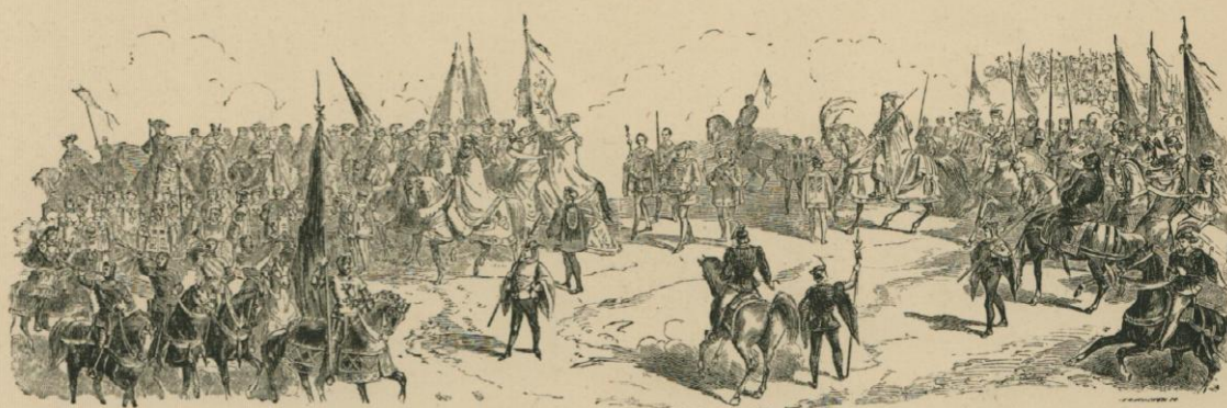
CAVALCADE ORGANISÉE A L'OCCASION DU XXV e ANNIVERSAIRE DE LÉOPOLD I er . Cortège de la Toison d'Or.

C'était tout un site curieux et joli que cette campagne joyeuse, riante, remplie de